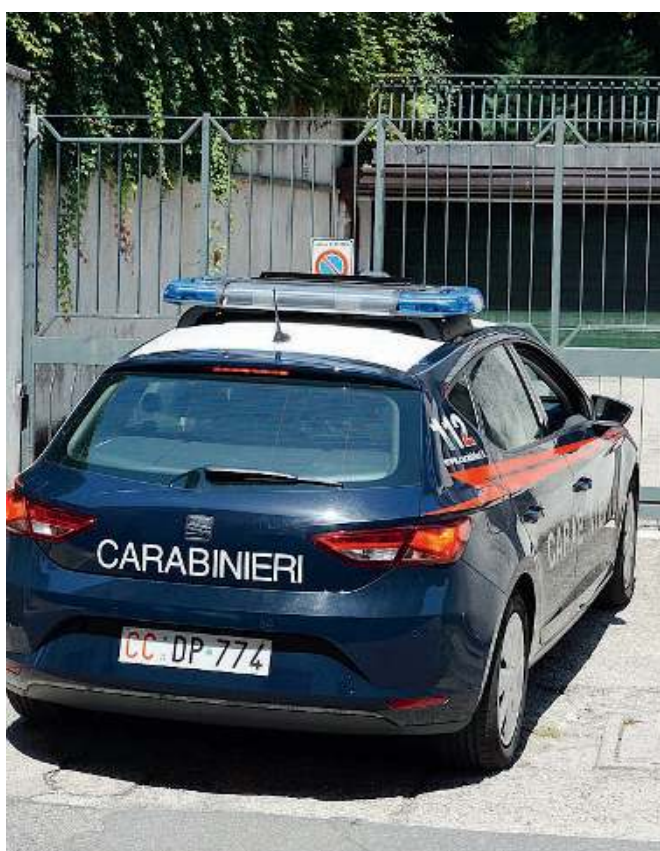
L'operazione. I carabinieri hanno rintracciato e arrestato i ladri

po giorno si sono aggiunti elementi che hanno consolidato l'ipotesi dei carabinieri. Alla famiglia i carabinieri riconducono episodi accaduti a Pisogne,