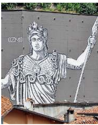
Dea. La Minerva di piazza Mercato

■ Quasi cinque anni di progetto per lasciare su tredici muri di tutta la Valle dei segni indelebili e cubitali: basti pensare alla Minerva di piazza Mercato a Breno, all'orso della Casa del Parco di Veza o alla «Gioconda» sulle case popolari di Angone. Ora per l'iniziativa del Distretto culturale «Wall in art» è tempo di fermarsi e riflettere: lo si farà oggi al Palazzo della