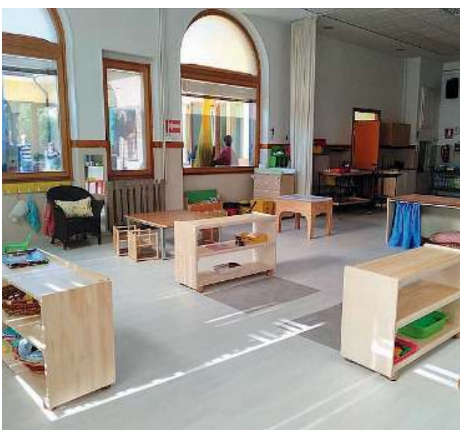
A misura di bambino. L'interno della scuola materna